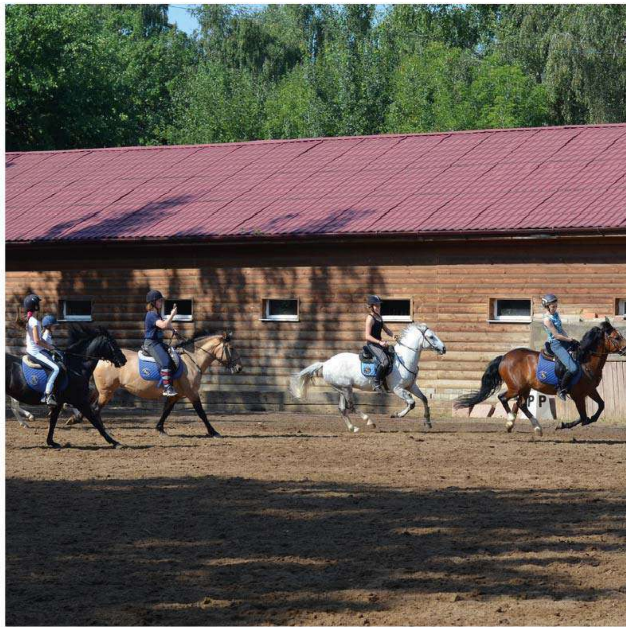
Конный клуб «Матадор»