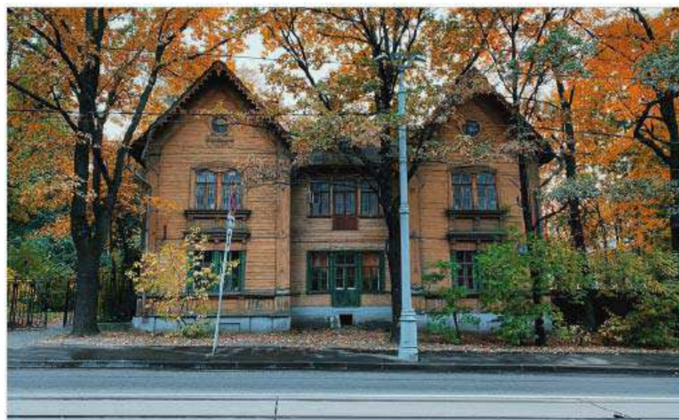
Дом Василия Робертовича Вильямса