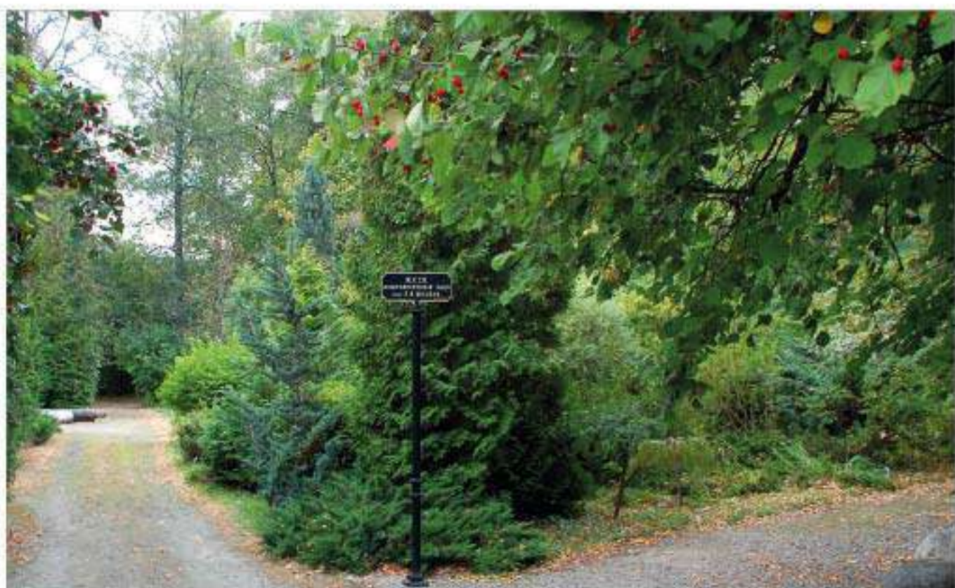
Дендрологический сад им. Р. И. Шредера