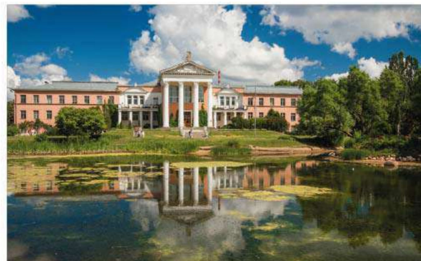
Сад вдохновения и созидания